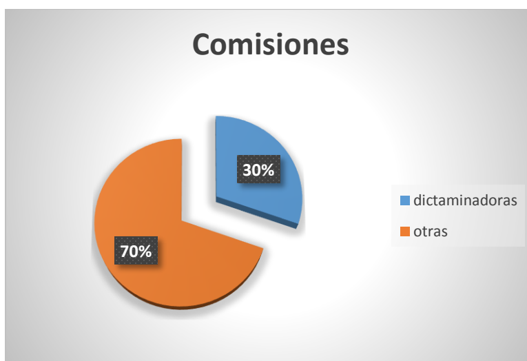
Grafica Número 3. Elaboración propia del Centro de Estudios para el Adelanto de las Mujeres y la Equidad de Género CEAMEG, con datos de la página oficial de la Cámara de Diputados consultada el 9 de junio del 2016.

Del total de los 56 documentos parlamentarios entre iniciativas presentadas y minutas recibidas en materia de derechos humanos de las mujeres durante el primer periodo de sesiones ordinario correspondiente al primer año legislativo de la LXIII Legislatura se encuentran en 17 de las 56 comisiones ordinarias para su análisis y dictaminación.