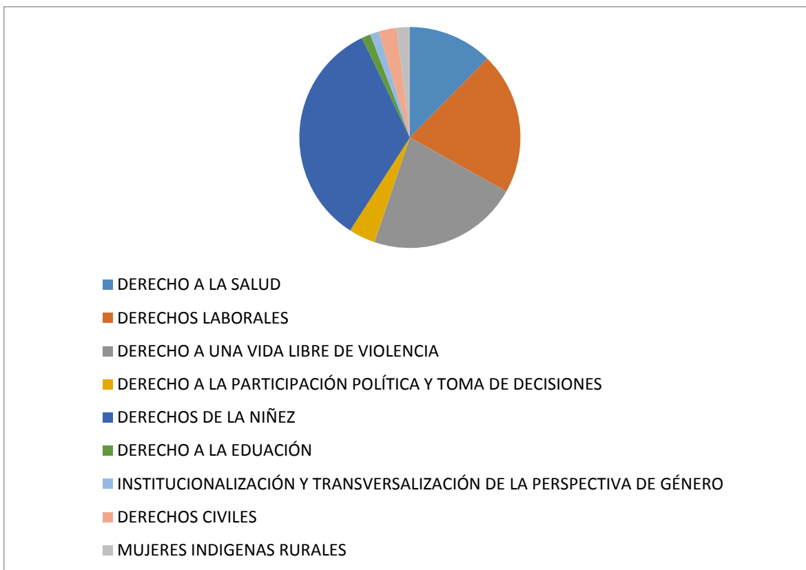
Gráfica Número 2. Elaboración propia del Centro de Estudios para el Adelanto de las Mujeres y la Equidad de Género CEAMEG, con datos de la página oficial de la Cámara de Diputados consultada el 19 de marzo del 2016.